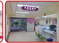
Rumah sakit bersalin dan anak