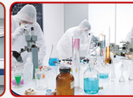
Lembaga penelitian ilmiah